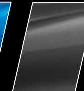
Gris Metálico (1G3)