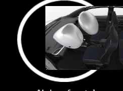
Air bag frontales