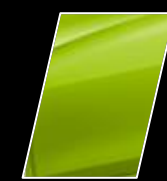
Verde Metálico (6W2)