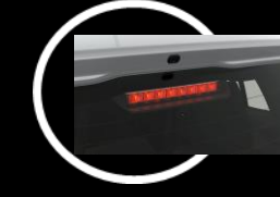
Tercera luz de freno