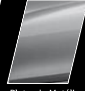
Plateado Metálico (1D4)