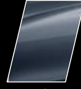
Azul Grisáceo Metálico (8R3)