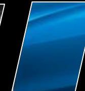
Azul Mica Metálico (8W9)