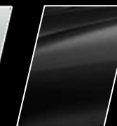
Negro Actitud (218)