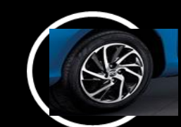
Rines 15 de aluminio