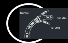
Control de estabilidad VSC