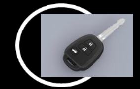
Llave de encendido