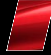
Rojo Mica Metálico (3R3)