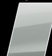
Súper Blanco II (040)