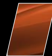
Anaranjado Metálico (4R8)